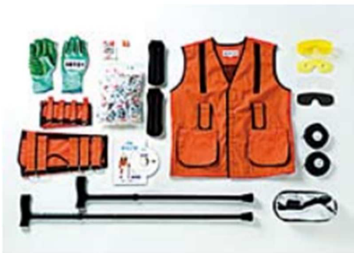
<高齡者模擬體驗組>